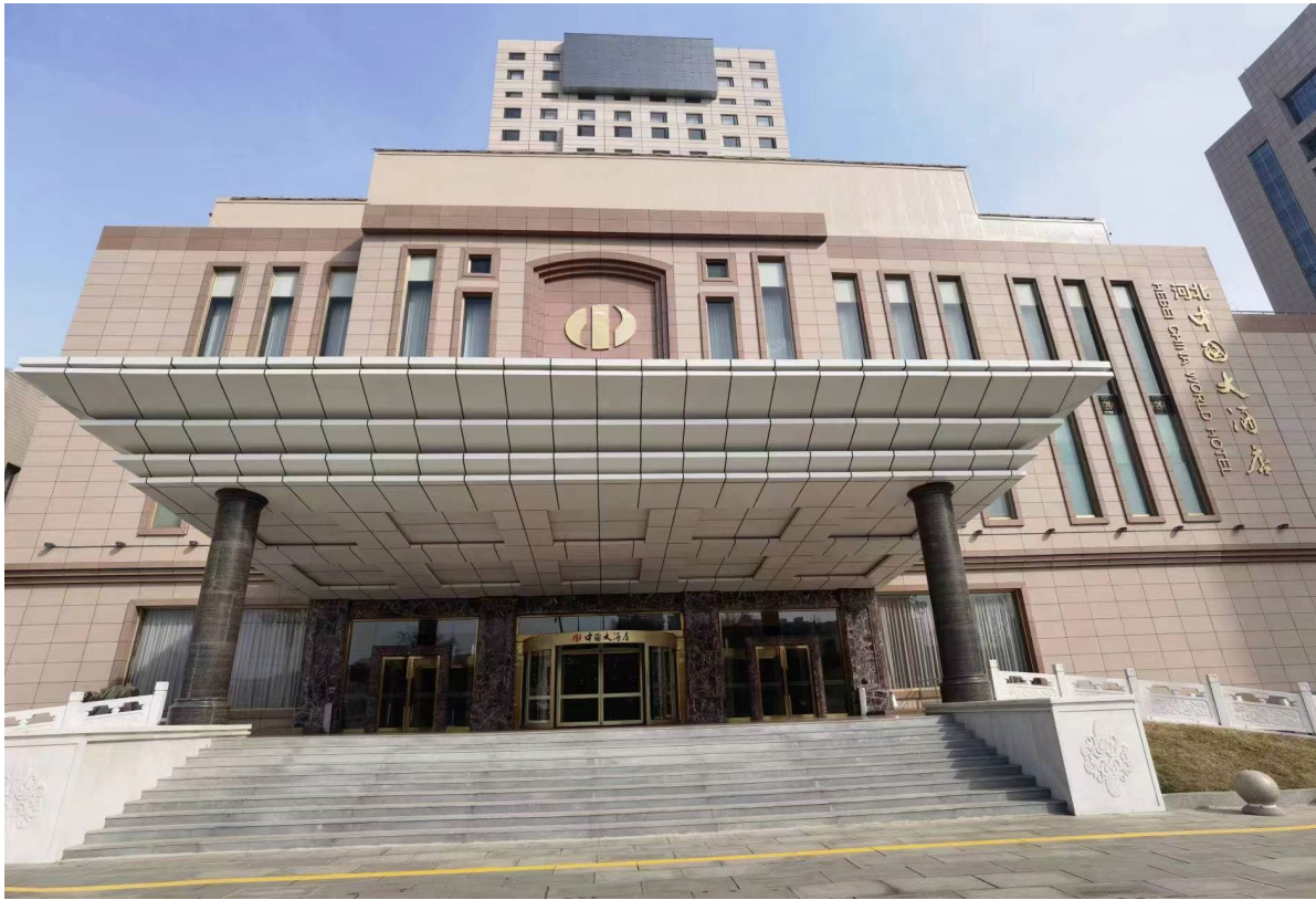
附：河北中国大酒店图片