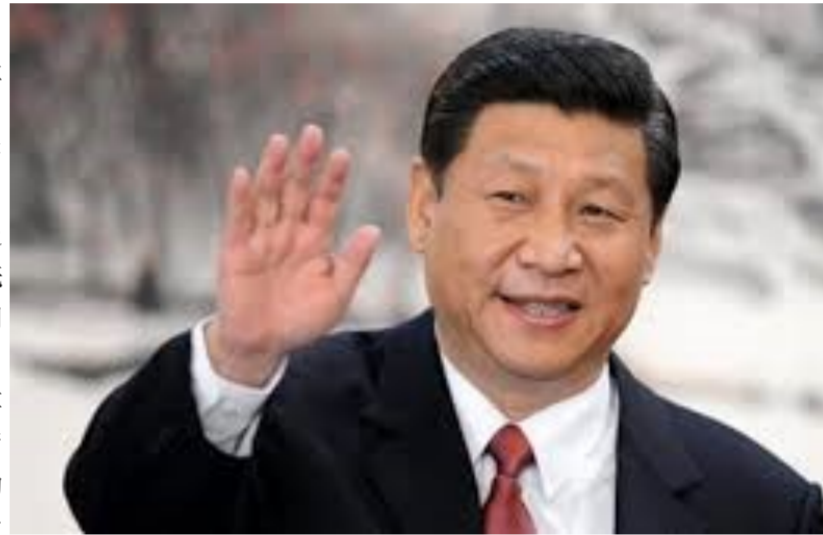
实现全面建成小康社会奋斗目标, 实现社会主义

延安是革命圣地, 你们奔赴延安, 追寻革命前辈伟大而艰辛的历史足迹, 学习延安精神, 坚定理想信念, 锤炼意志品质, 把激昂的青春梦融入伟大的中国梦, 体现了当代中国青年奋发有为的精神风貌。